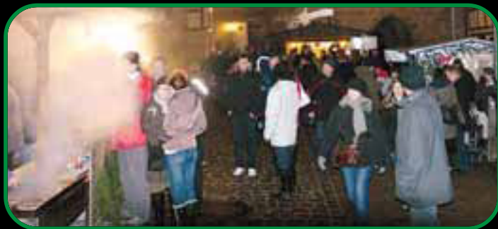
Auch ohne Schnee kamen abends beim Bummel durch den Wendelsteiner Weihnachtsmarkt dank der Kälte winterliche Gefühle auf