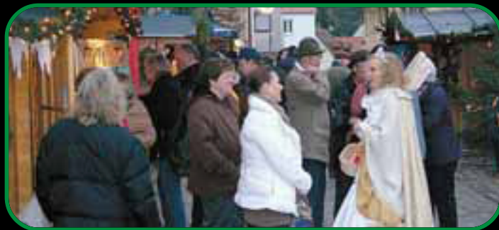
Auch das Wendelsteiner Christkind besuchte an beiden Markttagen den Weihnachtsmarkt im Wendelsteiner Altort