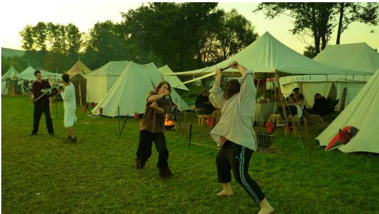
Schaukampftraining vor dem Lager am Cave Gladium in Furth im Wald

Furth im Wald war – wie die Jahre davor – als fester Lagertermin ohne Schaukampf- oder Feuershowauftritte erhalten und stellte sich wieder als angenehmes Urlaubswochenende für die Mitglieder heraus. Aufgrund der hohen Temperaturen an diesem Augustwochenende wurde das zweite Sonnensegel des Vereins außerhalb des Publikumsbereichs als schattige Ruhezone für die Mitglieder aufgebaut, um sich gelegentlich zurückzuziehen.