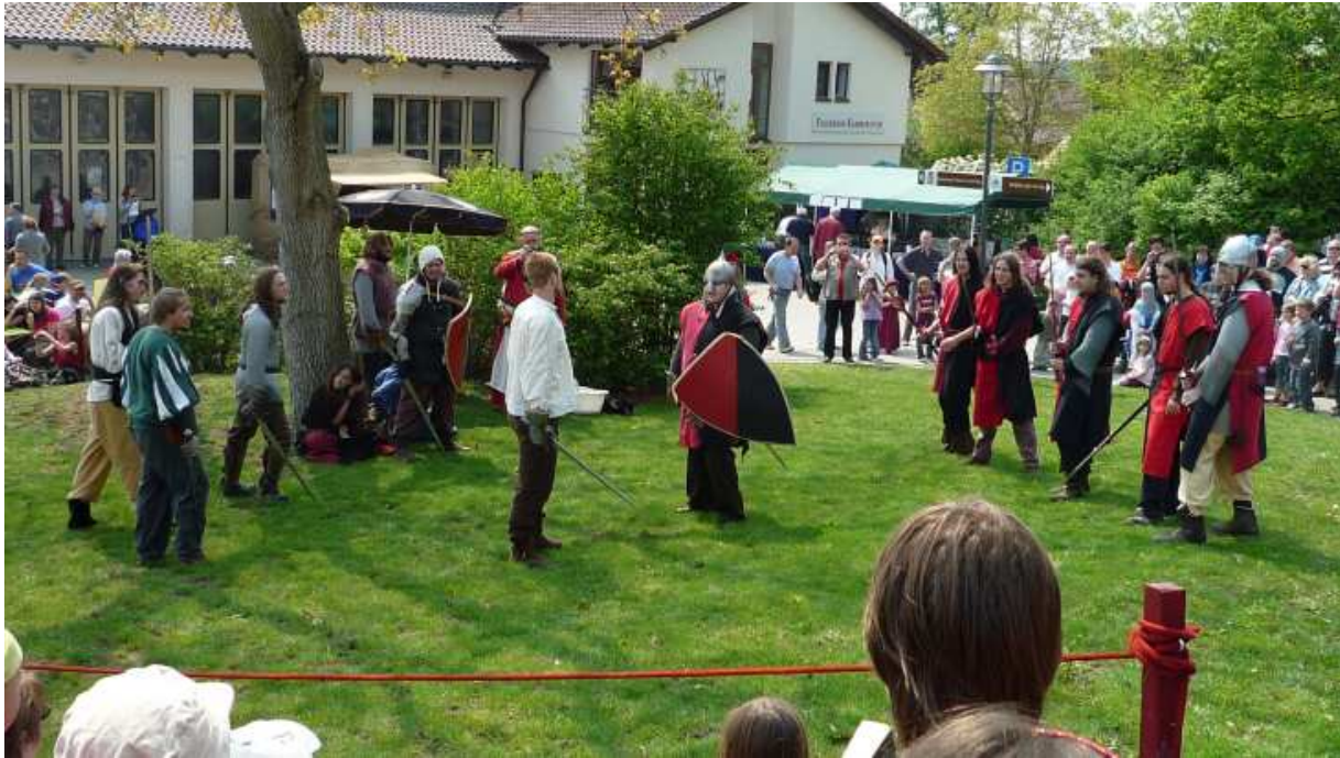
Insgesamt stellte der Ritterhaufen am Sagenfest 5 Schaukampfauftritte

2009 stellte für den Verein durchweg ein erfolgreiches Jahr dar. Das Highlight war wieder einmal das Sagenfest in Kammerstein, welches sein 10-jähriges Jubiläum feierte. Erstmals als 3-tägige Veranstaltung (durch den Feiertag am Freitag, den 01. Mai, gab es ein verlängertes Wochenende) stellte sich der Ritterhaufen sich der Aufgabe, an 3 aufeinander folgenden Tagen täglich mehrere Auftritte zu absolvieren.