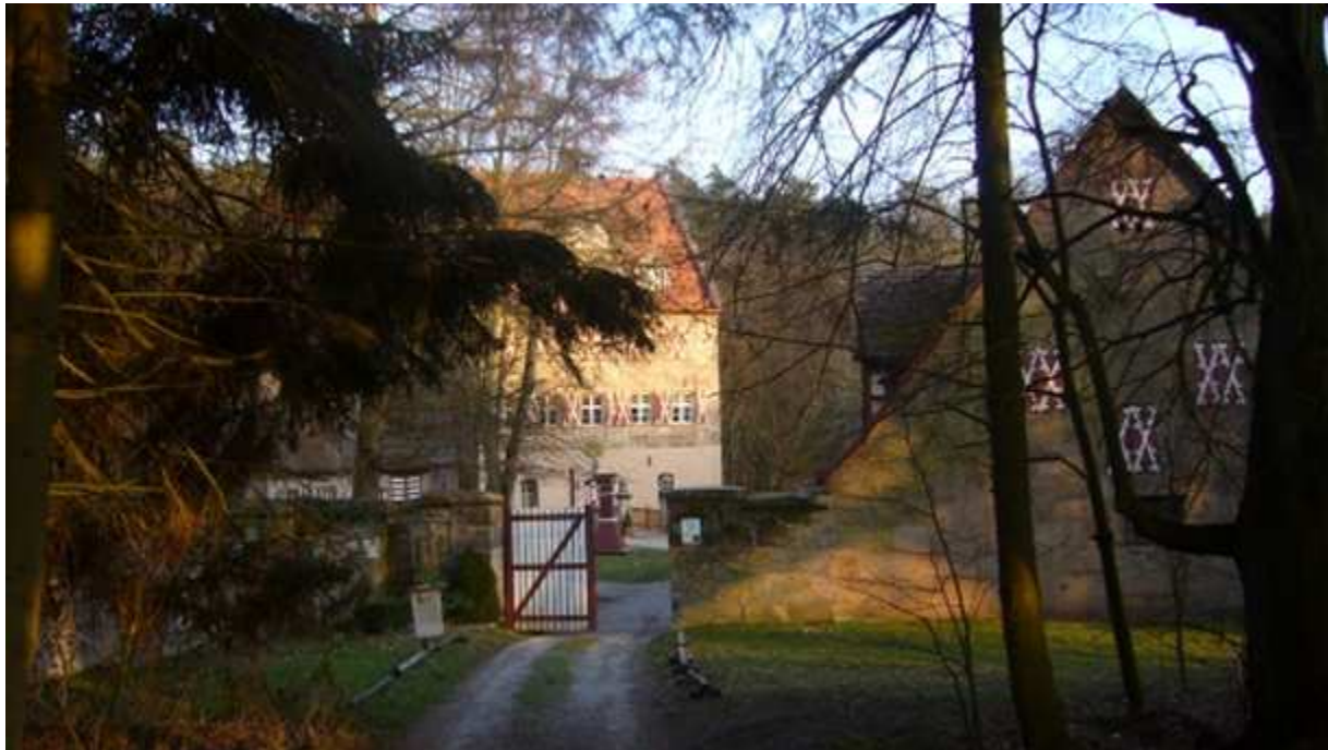
Schloss Kugelhammer im Frühjahr 2008

Bis kurz nach der Vereinsgründung war Schloss Kugelhammer in Röthenbach bei Sankt Wolfgang die Vereinsresidenz des Fränkischen Ritterhaufens. Dort wurde 2005 die Gruppe gegründet, 2009 der Verein.