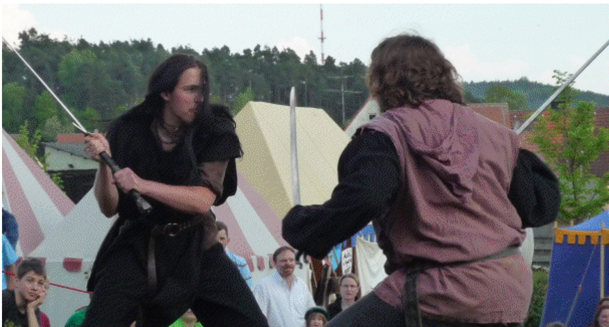
Samstag in Kammerstein

Das Schaukampfgeschehen lässt sich 2009 auf 4 verschiedene Buchungen eingrenzen. Damit hält sich der Anteil der Schaukampfauftritte im Gegensatz zu den Bereichen Feuershow und Lagerleben weiterhin gering, was sich entsprechend auch an der Entwicklung erkennen lässt. Der Aufbau und Ablauf der Schaukämpfe ist zwar durch die Erfahrung des Vereins auf einem guten Niveau, stagniert aber durch die Unterforderung.