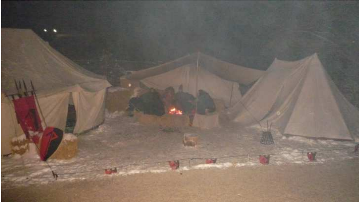
Die kälteste Nacht des Jahres für den Ritterhaufen

Furth im Wald war – wie die Jahre davor – als fester Lagertermin ohne Schaukampf- oder Feuershowauftritte erhalten und stellte sich wieder als angenehmes Urlaubswochenende für die Mitglieder heraus. Aufgrund der hohen Temperaturen an diesem Augustwochenende wurde das zweite Sonnensegel des Vereins außerhalb des Publikumsbereichs als schattige Ruhezone für die Mitglieder aufgebaut, um sich gelegentlich zurückzuziehen.