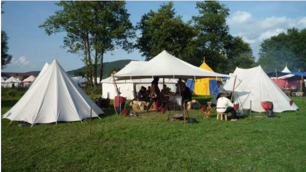
Lager in Furth im Wald