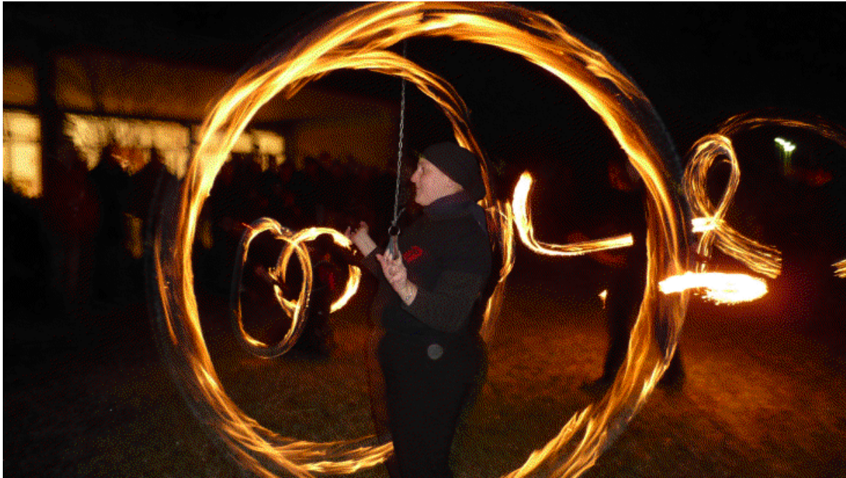
Zugabe in Roth