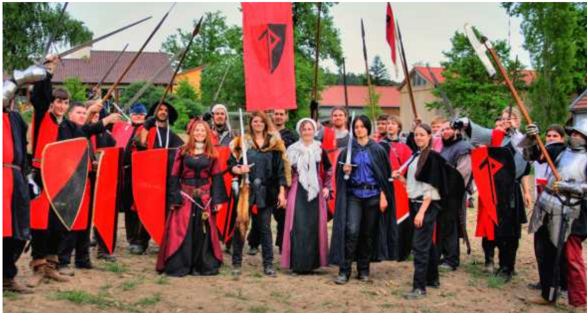
Ein Teil des Vereins auf dem Sagenfest in Kammerstein