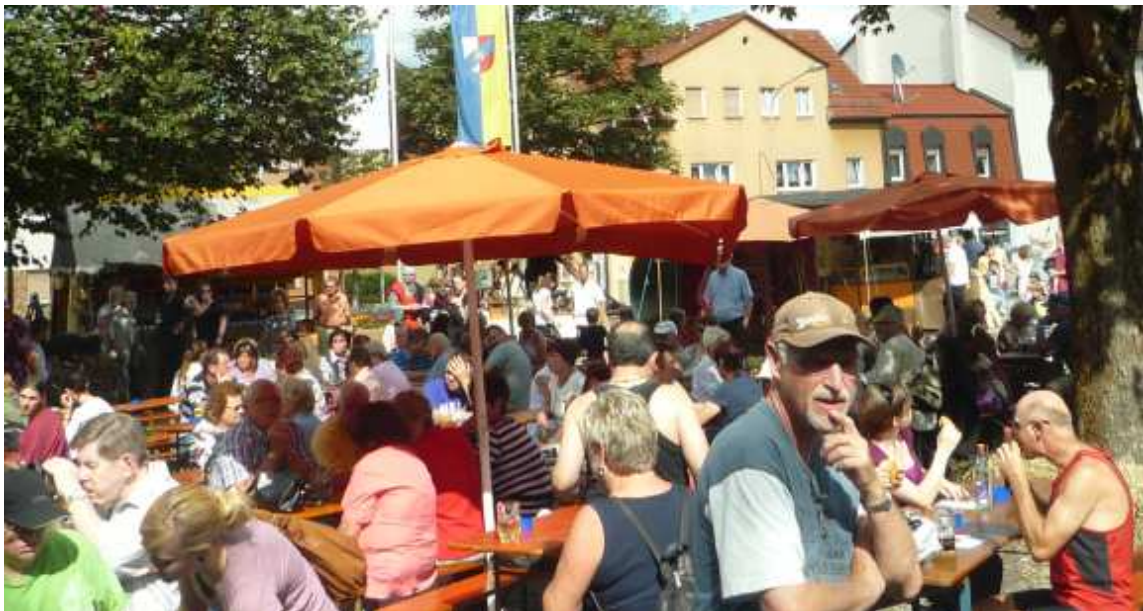
Das Mittelalterfest in Röthenbach war ständig gut besucht

Das restliche Jahr erwies sich ebenfalls noch als ereignisreich – vor allem für die Feuershow, die auf 3 Weihnachtsmärkten im fränkischen Umland austrat.