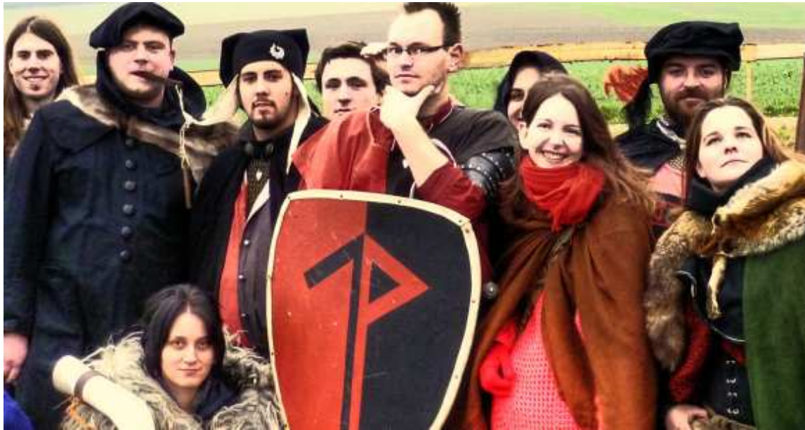
In Wintergewandung auf Schloss Guteneck

Die letzte Mittelalterveranstaltung war mal wieder ein Marktbesuch auf Schloss Guteneck.