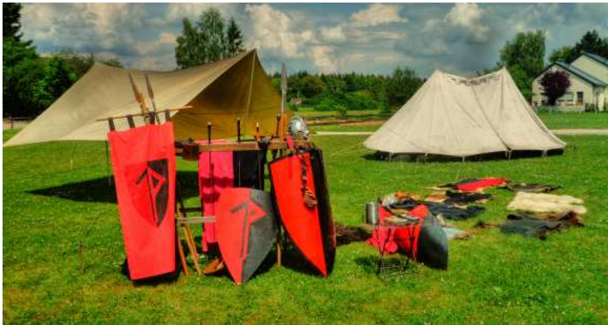
Lager auf dem Spielfestfest in Fischbach

Insgesamt fanden 6 Lagerleben-Auftritte statt. Einer davon – wie üblich Furth im Wald - stellte reines Lagerleben dar. In Röthenbach an der Pegnitz fand nur ein internes Lager abseits des Mittelalterfestes statt, da der Platz am Veranstaltungsort begrenzt war und lieber mehr Stände aufstellte.