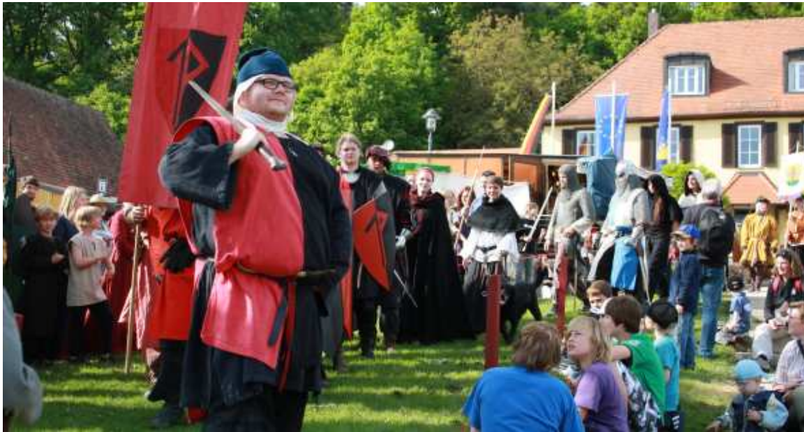
Einmarsch auf dem Sagenfest

nach Beschwerden von außerhalb nach einer Entscheidung des Vorstandes nicht mehr mit uns lagern wird. Trotz dieser Probleme bleibt das Wochenende positiv in Erinnerung.