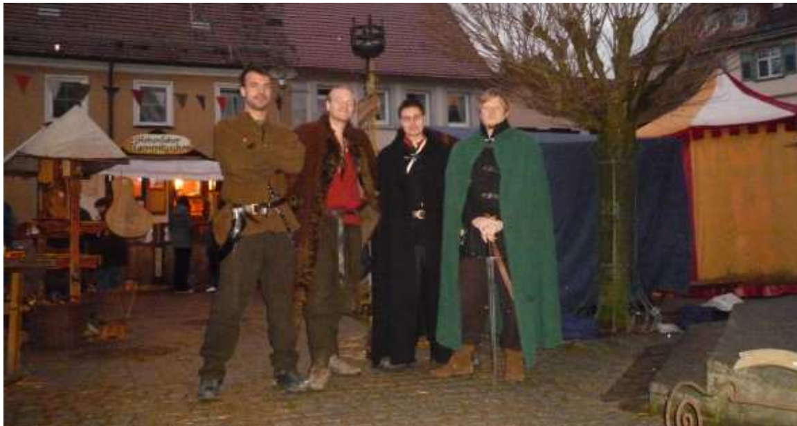
Das Jahr startete für den Haufen mit einem Besuch in Kirchberg

Geplant waren eine zweite Veranstaltung in Eigenregie in Wolframs-Eschenbach als Addition zum dortigen Altstadtfest und ein Großauftritt auf Schloss Schillingsfürst. Ersteres fiel komplett aus, in Schillingsfürst kamen rechtliche Schwierigkeiten dazwischen. So wurde vor allem das Sommerprogramm für den Verein entspannter, als man eigentlich wollte, doch ergaben sich dafür andere Gelegenheiten und man konnte letztendlich mehr Zeit in die Planung für Röthenbach stecken.