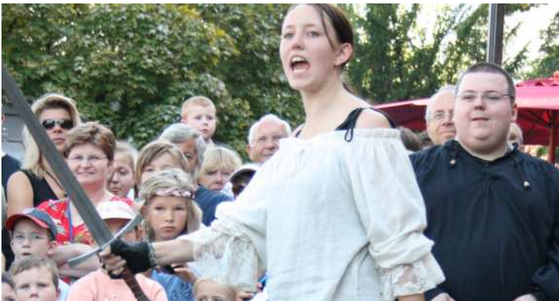
Schaukämpfe in Röthenbach