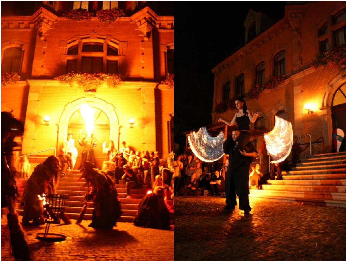
Auftritt der Oberpfälzer Schlossteufeln & Feuershow