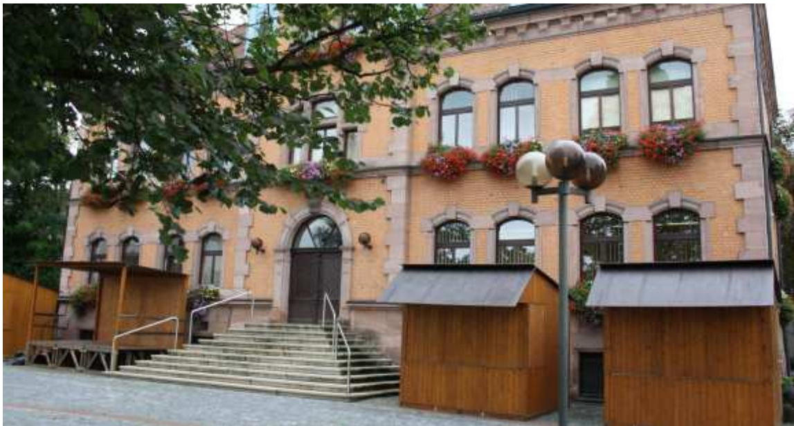
Das Rathaus in Röthenbach vor dem Mittelalterfest