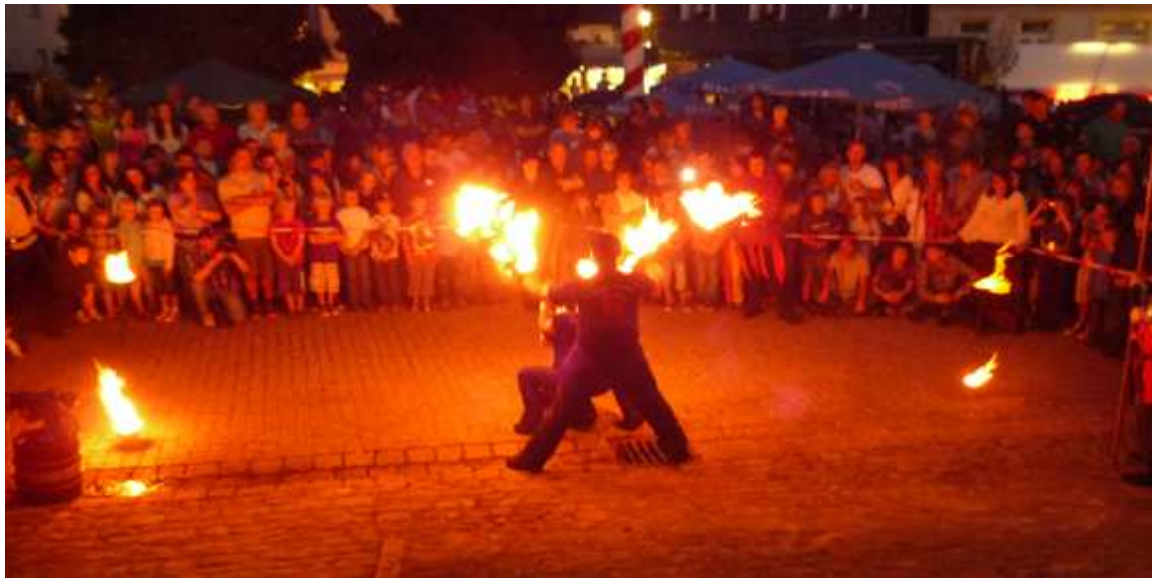
Feuershow in Burgkunstadt

das Cave Gladium auf dem Programm, welches aber von Veranstalter-Seite eher enttäuschte. Brachte die Veranstaltung schon in den letzten Jahren immer weniger Innovation mit sich, hat sich dieses Jahr auch noch ein direkter Vorfall mit dem Veranstalter ereignet, der wahrscheinlich das Ende unserer jährlichen Besuche in Furth im Wald sein wird. Da der Ritterhaufen dieses Jahr einen Tag später auf der Veranstaltung aufschlug, wurde von unserem Lagermeister mit der Organisation vereinbart, dass man auch noch verspätet auf das Gelände einfahren dürfe. Vor Ort wurde das Ritterhaufen-Team dann aber unfreundlich abgewiesen und man musste die komplette Lagerausrüstung fast über einen Kilometer unnötig zum Lagerplatz tragen.