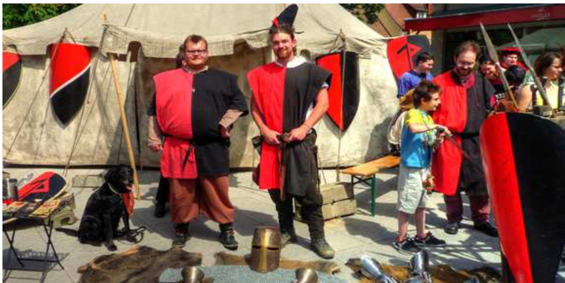
Lager und Waffenschau in Feucht

Es folgten zwei kleinere Auftritte in Fischbach auf dem Spielplatzfest und beim Lenzmond Festival in Neumarkt zugunsten des dort ansässigen Familienzentrums bis wir unser Lager in Feucht aufschlagen durften.